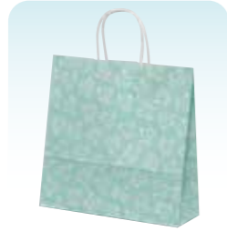
HX ロマン ブルー ●片艶晒100g/㎡ ●41.2g/1枚 ●紙1本ヨリ白 ●320×110×320mm ●200枚(50枚×4包) ●商品コード XZT01095 ●JANコード 4515671672921