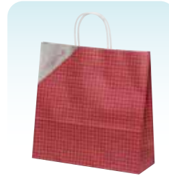
HX ネット レッド ●片艶晒100g/㎡ ●41.2g/1枚 ●紙1本ヨリ白 ●320×110×320mm ●200枚(50枚×4包) ●商品コード XZT00732 ●JANコード 4515671671313