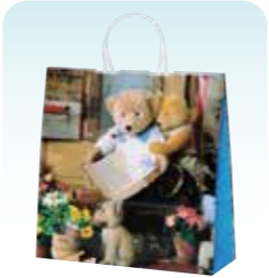
HX ハニーベアー ●コート120g/㎡ ●53.52g/1枚 ●紙1本ヨリ白 ●320×110×320mm ●200枚(50枚×4包) ●商品コード XZT00752 ●JANコード 4515671675076