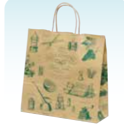
HX シルバースミス ●片艶晒100g/㎡ ●40.0g/1枚 ●紙1本ヨリ未晒 ●320×110×320mm ●200枚(50枚×4包) ●商品コード XZT00750 ●JANコード 4515671671535