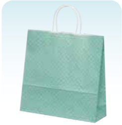
HX 水玉 ブルー ●片艶晒100g/㎡ ●46.4g/1枚 ●紙1本ヨリ白 ●320×110×320mm ●200枚(50枚×4包) ●商品コード XZT00733 ●JANコード 4515671670262