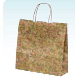
HX クラシック ●片艶晒100g/㎡ ●46.4g/1枚 ●紙1本ヨリ未晒 ●320×110×320mm ●200枚(50枚×4包) ●商品コード XZT00754 ●JANコード 4515671670323