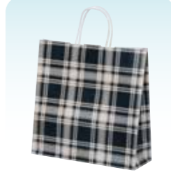
HX ロイヤルチェックブルー ●コート120g/㎡ ●44.7g/1枚 ●紙3本ヨリ白 ●320×110×320mm ●200枚(50枚×4包) ●商品コード XZT00738 ●JANコード 4515671671375