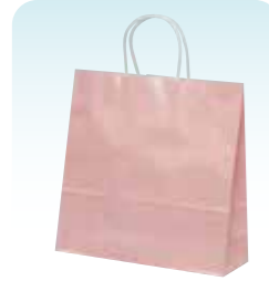
HX クリスタル ピンク ●片艶晒100g/㎡ ●46.2g/1枚 ●紙1本ヨリ白 ●320×110×320mm ●200枚(50枚×4包) ●商品コード XZT00741 ●JANコード 4515671672617