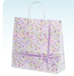
HX 紫花(アイカ) ●片艶晒100g/㎡ ●46.4g/1枚 ●紙1本ヨリ白 ●320×110×320mm ●200枚(50枚×4包) ●商品コード XZT67651 ●JANコード 4515671676516