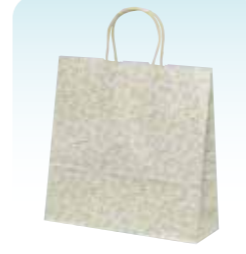
HX ルミエール ●片艶晒100g/㎡ ●46.4g/1枚 ●紙1本ヨリアイボリー ●320×110×320mm ●200枚(50枚×4包) ●商品コード XZT00744 ●JANコード 4515671672709