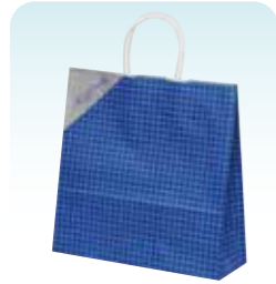
HX ネット ブルー ●片艶晒100g/㎡ ●41.2g/1枚 ●紙1本ヨリ白 ●320×110×320mm ●200枚(50枚×4包) ●商品コード XZT00731 ●JANコード 4515671671306