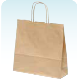
HX 未晒 無地 ●片艶晒60g/㎡ ●46.4g/1枚 ●紙1本ヨリ未晒 ●320×110×320mm ●200枚(50枚×4包) ●商品コード XZT00739 ●JANコード 4515671672983