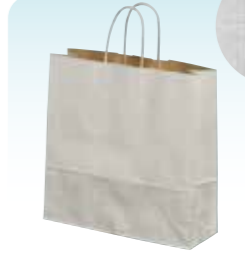
HX リンネル ●コート125g/㎡ ●55.3g/1枚 ●紙1本ヨリグレー ●320×110×320mm ●200枚(50枚×4包) ●商品コード XZT67659 ●JANコード 4515671676592