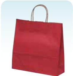
HX ルージュ ●片艶晒100g/㎡ ●39.28g/1枚 ●紙1本ヨリ未晒 ●320×110×320mm ●200枚(50枚×4包) ●商品コード XZT01094 ●JANコード 4515671672716