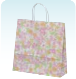
HX ソフィア ●片艶晒100g/㎡ ●46.4g/1枚 ●紙1本ヨリ白 ●320×110×320mm ●200枚(50枚×4包) ●商品コード XZT00740 ●JANコード 4515671670286