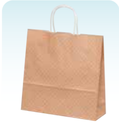
HX 水玉 ピンク ●片艶晒100g/㎡ ●46.4g/1枚 ●紙1本ヨリ白 ●320×110×320mm ●200枚(50枚×4包) ●商品コード XZT01091 ●JANコード 4515671670279