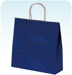
HX マリン ●片艶晒100g/㎡ ●39.28g/1枚 ●紙1本ヨリ未晒 ●320×110×320mm ●200枚(50枚×4包) ●商品コード XZT00745 ●JANコード 4515671672730