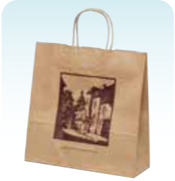
HX ロワール ●片艶晒100g/㎡ ●39.28g/1枚 ●紙1本ヨリ未晒 ●320×110×320mm ●200枚(25枚×8束) ●商品コード XZT00751 ●JANコード 4515671675014