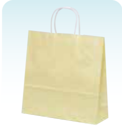
HX クリスタル イエロー ●片艶晒100g/㎡ ●46.2g/1枚 ●紙1本ヨリ白 ●320×110×320mm ●200枚(50枚×4包) ●商品コード XZT00742 ●JANコード 4515671672624