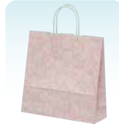
HX ロマン ピンク ●片艶晒100g/㎡ ●41.2g/1枚 ●紙1本ヨリ白 ●320×110×320mm ●200枚(50枚×4包) ●商品コード XZT00749 ●JANコード 4515671672938