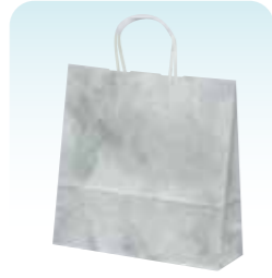
HX ルネッサンスグレイ ●片艶晒100g/㎡ ●46.4g/1枚 ●紙1本ヨリ白 ●320×110×320mm ●200枚(50枚×4包) ●商品コード XZT00737 ●JANコード 4515671670415