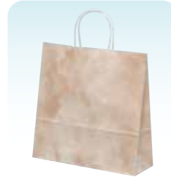
HX ルネッサンスサーモン ●片艶晒100g/㎡ ●46.4g/1枚 ●紙1本ヨリ白 ●320×110×320mm ●200枚(50枚×4包) ●商品コード XZT00736 ●JANコード 4515671670408