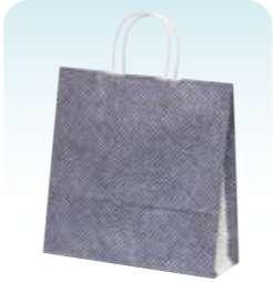
HX シボリ ●片艶晒100g/㎡ ●46.4g/1枚 ●紙1本ヨリ白 ●320×110×320mm ●200枚(50枚×4包) ●商品コード XZT00734 ●JANコード 4515671670170