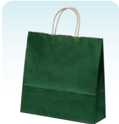
HX エメラルド ●片艶晒100g/㎡ ●39.28g/1枚 ●紙1本ヨリ未晒 ●320×110×320mm ●200枚(50枚×4包) ●商品コード XZT00746 ●JANコード 4515671672754