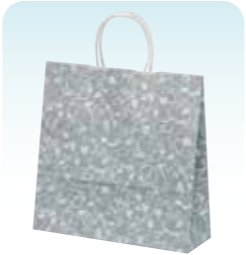
HX モダン ●片艶晒100g/㎡ ●46.4g/1枚 ●紙1本ヨリ白 ●320×110×320mm ●200枚(50枚×4包) ●商品コード XZT00748 ●JANコード 4515671672907