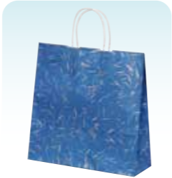
HX 風雅 ブルー ●片艶晒100g/㎡ ●46.4g/1枚 ●紙1本ヨリ白 ●320×110×320mm ●200枚(50枚×4包) ●商品コード XZT00730 ●JANコード 4515671671290