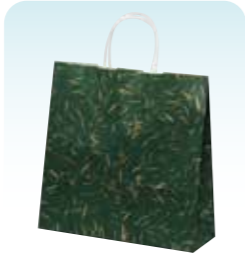
HX 風雅 グリーン ●片艶晒100g/㎡ ●46.4g/1枚 ●紙1本ヨリ白 ●320×110×320mm ●200枚(50枚×4包) ●商品コード XZT00729 ●JANコード 4515671671283