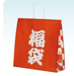
HX 梅市松 福袋 ●片艶晒100g/㎡ ●46.4g/1枚 ●紙1本ヨリ白 ●320×110×320mm ●200枚(25枚×4包) ●商品コード XZT67508 ●JANコード 4515671675083