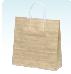
HX フランセ ●片艶晒100g/㎡ ●44.62g/1枚 ●紙1本ヨリ白 ●320×110×320mm ●200枚(50枚×4包) ●商品コード XZT67646 ●JANコード 4515671676486