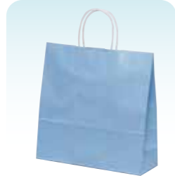
HX クリスタル ブルー ●片艶晒100g/㎡ ●46.2g/1枚 ●紙1本ヨリ白 ●320×110×320mm ●200枚(50枚×4包) ●商品コード XZT00743 ●JANコード 4515671672631