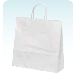
HX 晒 無地 ●片艶晒100g/㎡ ●46.4g/1枚 ●紙1本ヨリ白 ●320×110×320mm ●200枚(50枚×4包) ●商品コード XZT00728 ●JANコード 4515671670989