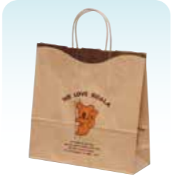
HX コアラ ●片艶晒100g/㎡ ●41.2g/1枚 ●紙1本ヨリ未晒 ●320×110×320mm ●200枚(50枚×4包) ●商品コード XZT00747 ●JANコード 4515671672808